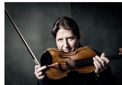
Künstlerische Leitung: Denis Goldfeld